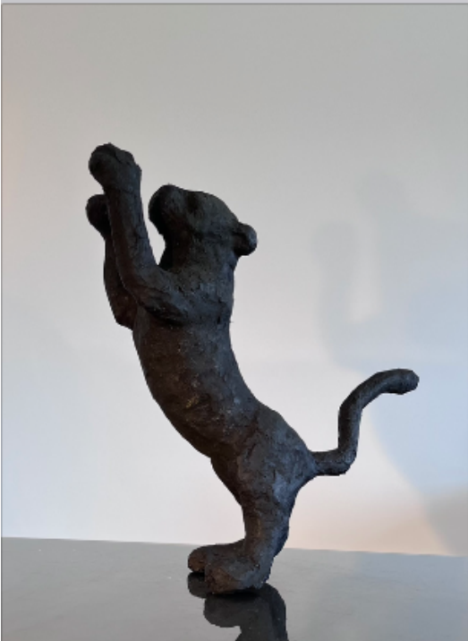
Puma en chasse