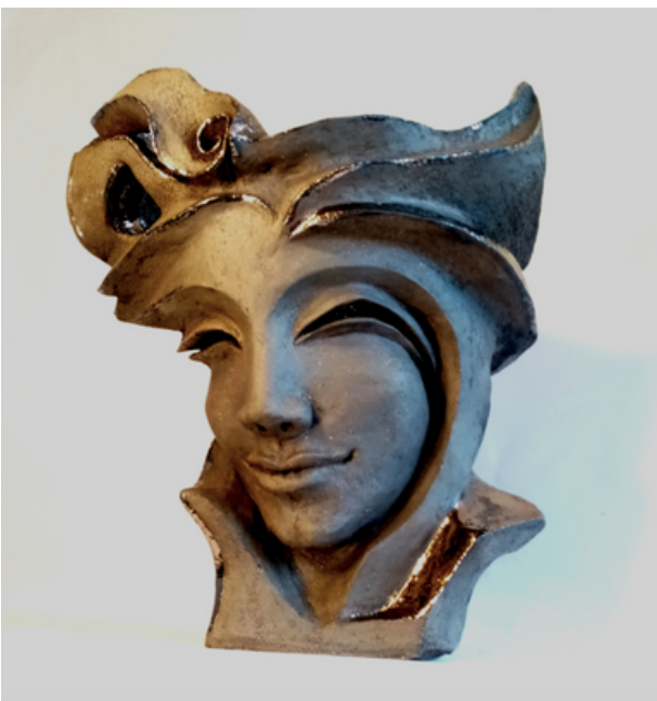
La Belle de Biarritz